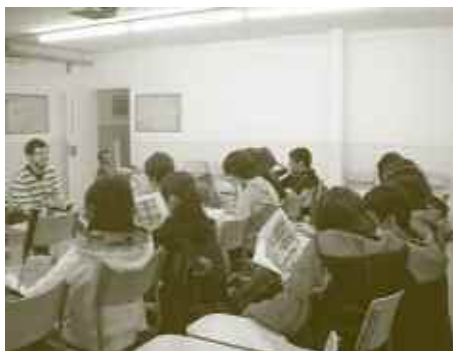
SESSIÓ DE ZÀPPING

3. Finalment, l' ARXIU és el registre del projecte, que hem dissenyat amb dues accions. D'una banda, el Meeting point , proposat amb un doble objectiu: primer, que els i les alumnes participants poguessin conèixer i parlar amb els artistes de manera directa i, segon, que poguessin conèixer Can Xalant, el centre de creació i pensament contemporani de Mataró. L'altra acció ha estat l' exposició "Zona intrusa" (Espai f, del 13 d'abril al 27 de maig de 2007), mostra que posa