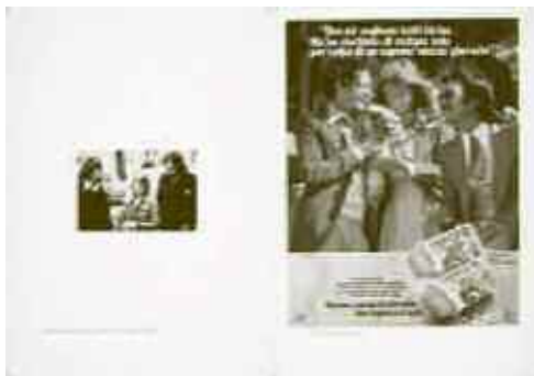
SANJA IVEKOVIC, DOBLE VIDA, 1975