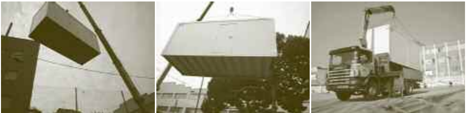
TRASLLAT D'UNA SALA D'EXPOSICIONS ALS INSTITUTS

En aquest marc sorgeix Zona intrusa , un projecte pensat per itinerar als instituts mataronins, plantejat com l'esbós d'un trasllat d'una sala d'exposicions als patis dels instituts : la intrusió del llenguatge artístic contemporani amb un format que capgirés l'ordre habitual amb què els adolescents tenen contacte amb els formats expositius, provoqués preguntes a l'entorn de les experiències i que, més enllà de les matèries habituals, servís per provocar un seguit de