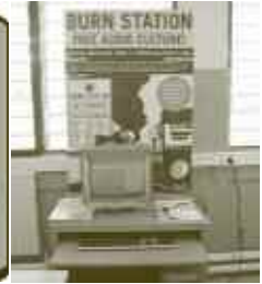
PLATONIQU, BURN STATION , 2005-06. ORDINADOR AMB SISTEMA OPERATIU GNU/LINUX

reflexions sobre qüestions que afecten directament la vida d'aquests adolescents.