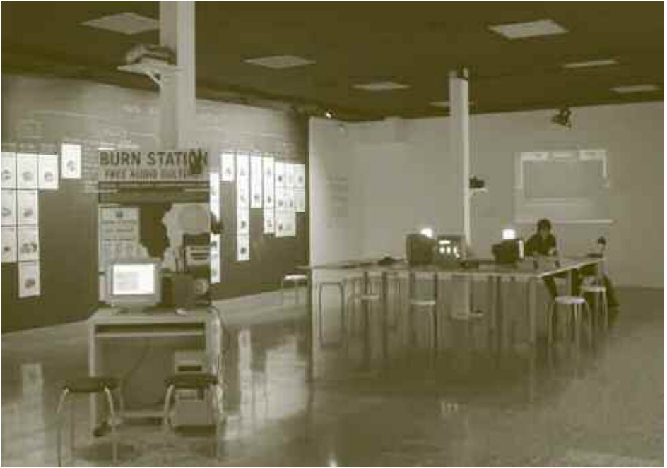
EXPOSICIÓ A L'ESPAI F

l'èmfasi en els treballs que s'han generat conjuntament amb els alumnes dels centres participants, però també documenta tot el procés itinerant, documenta el muntatge de l'exposició i ofereix tots els materials concebuts, produïts i visionats durant tot el projecte per a la seva consulta.