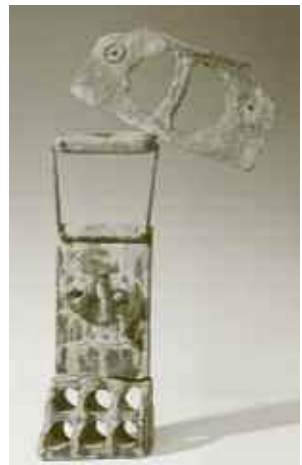
JOAN MIRÓ, TÊTE, 1969 © SUCCESIÓ MIRÓ 2005

Mostra organitzada pel Departament de Cultura de la