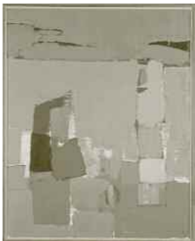
NICOLAS DE STAËL, FIGURES AU BORD DE LA MER, 1952. KUNSTSAMMLUNG NORDRHEIN-WESTFALEN, DUSSELDORF