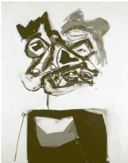
ANTONIO SAURA, EDITH , 1961

«VII edició d'Arts Plàstiques». Col·lecció d'artistes de Sant Joan Despí. Fins al 15 de juliol.