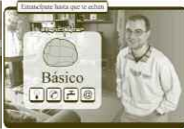
EMANCIPATOR BUSINESS, EMANCIPATOR BUBBLE , 2003-04. PROJECCIÓ DE DVD / 5'