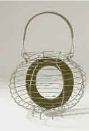
JOAN BROSSA, O D'OUERA, 1982

presenta també dues pel·lícules amb guions de Brossa, dirigides per Pere Portabella i Frederic Amat, respectivament.