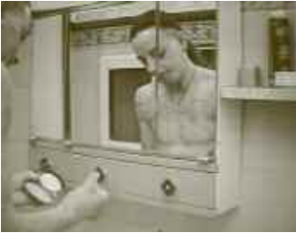
JORDI MITJÀ, PINTURA SOBRE PELL CREMADA , 2001. PROJECCIÓ DE DVD / 6'24"